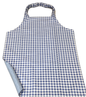
Delantal o mandil